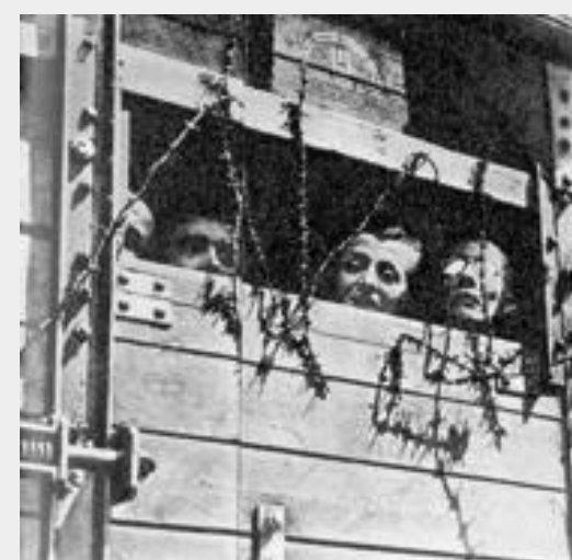
La giornata della memoria ricorda la scoperta di Auschwitz