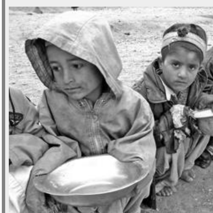
La povertà e l'abbandono aprono la strada allo sfruttamento dei minori

è stato docente di matematica e poi di religione in varie scuole. Ha insegnato al liceo classico Vittorio Emanuele II a Palermo dal '78 al '93. A Palermo e in Sicilia è stato tra gli animatori di numerosi movimenti tra cui Presenza del Vangelo, Azione cattolica, Fuci, Equipes Notre Dame. Dal marzo del 1990 svolse il suo ministero sacerdotale anche presso la Casa Madonna dell'Accoglienza dell'Opera pia Cardinale Ruffini in favore di giovani donne e ragazze-madri in difficoltà. Il 29 settembre 1990 venne nominato parroco a San Gaetano, a Brancaccio, e nel 1992 assunse anche l'incarico di direttore spirituale al seminario arcivescovile di Palermo. Il 29 gennaio 1993 inaugurò a Brancaccio il centro Padre Nostro, che divenne il punto di riferimento per giovani e famiglie del quartiere. La sua attenzione si rivolse al recupero degli adolescenti già reclutati dalla criminalità mafiosa, riaffermando nel quartiere una cultura della legalità illuminata dalla fede. La sua attività pastorale ha costituito il movente dell'omici-