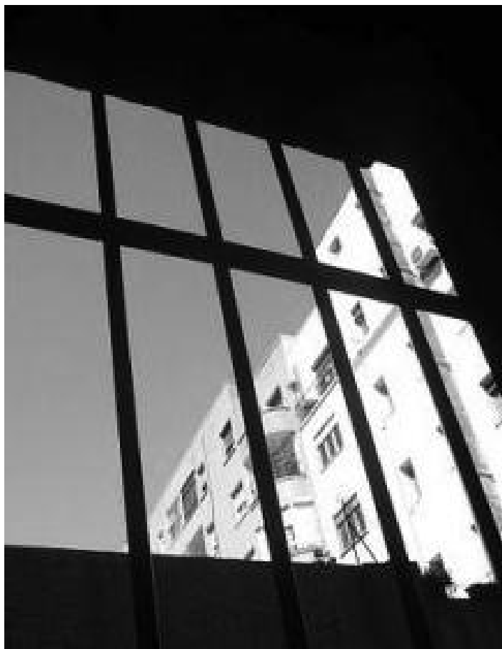
Le carceri scoppiano: i lavori socialmente utili ne alleggerirebbero il carico

Intercettazioni telefoniche, carceri sovraffollate, riapertura dell'Asinara e di Pianosa, stralcio della messa alla prova dal ddl Alfano dopo lo stop di Lega e An. È un menù decisamente pesante quello che il presidente del Consiglio ha proposto a Palazzo Chigi per parlare di riforme sulla giustizia e di emergenza penitenziaria. Il Guardasigilli Angelino Alfano ha evidenziato la crescita costante della popolazione carceraria: 1000 detenuti al mese, in tutto 58.462, a fronte di una capienza di 42.562. È matematico, dunque che a febbraio-marzo verrà superato il limite tollerabile di 63 mila carcerati. Si pensa alla costruzione di nuove carceri, ma la copertura finanziaria è insufficiente e per questo si sta pensando a misure tampone, quali l'utilizzazione delle camere di sicurezza delle questure e dei carabinieri per i detenuti in attesa di processo per direttissima oppure la riapertura di Pianosa e dell'Asinara per il 41bis, la messa alla prova per gli incensurati che possono chiederla con sospensione del provvedi-