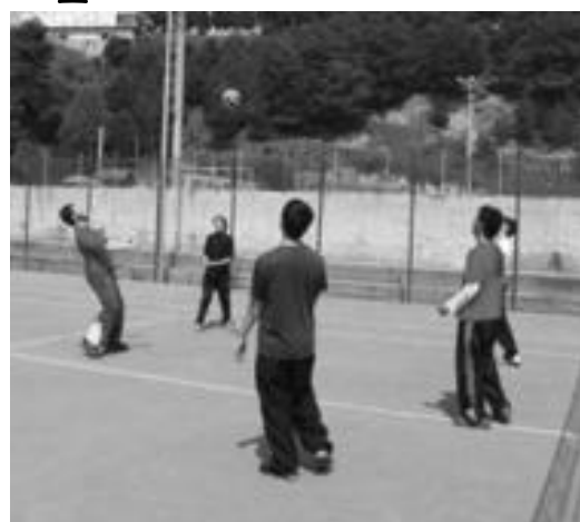
Lo sport in carcere è un'utile valvola di sfogo alle tensioni